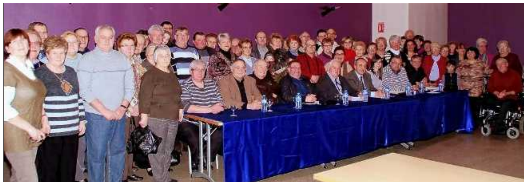
L'association loisirs animations en assemblée générale.

L'assemblée générale de Loisirs animations s'est déroulée récemment en la Maison de quartier du Wiesberg.