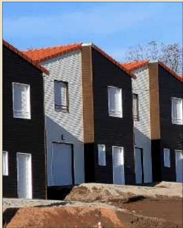
A la cité Cuvette les constructions vont bon train et participent à redonner une image positive de la ville.