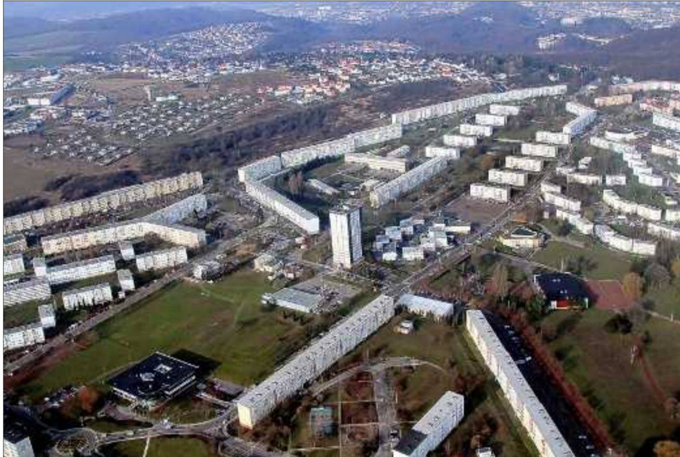
La cité de Behren, vue du ciel sur la photo, comporte 10 km de conduites de chauffage urbain.

Aux côtés de Maxime Castelain, pilote, Jean-Michel Ferry, ingénieur auprès du cabinet Guelle-Fuchs, a examiné les enregistrements de la caméra, les relevés photothermographiques, permettant d'interpréter l'ensemble des prises de vue et les paramètres de la caméra.