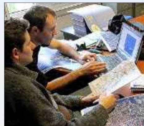
Traitement informatique des données qui arrivent du ciel.