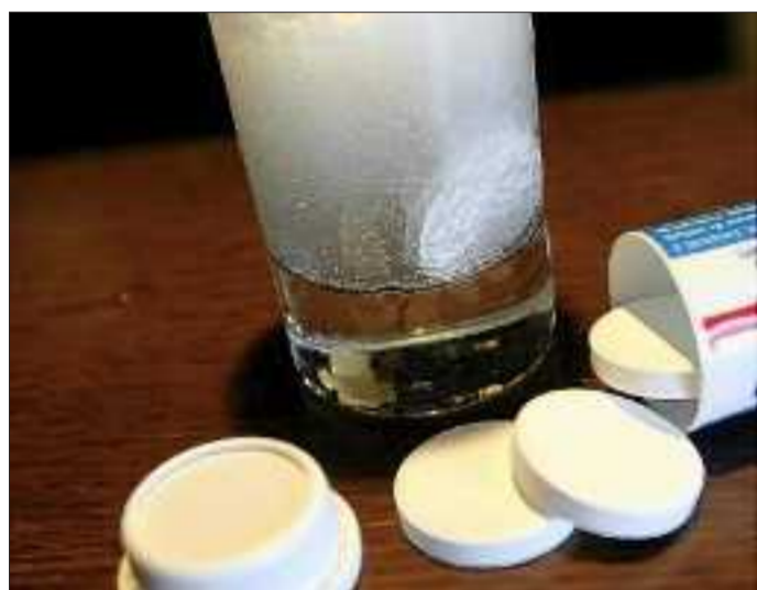
Les vertus de l'aspirine sont certes reconnues, mais selon un cardiologue, rien ne remplace l'appel du 15.

Victime d'un infarctus puis opéré pour un triple pontage, Claude Strentz revient sur les événements qui l'ont conduit à l'opération, tout en vantant les bienfaits de l'aspirine, qui aurait des vertus indéniables sur le cœur.